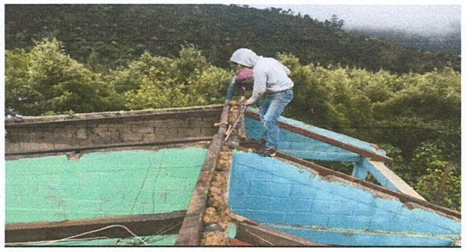
FOTO 2. SUSTITUCIÓN DE ESTRUCTURA DE SOPORTE DE MADERA