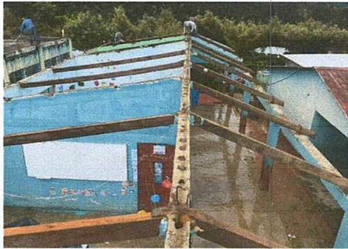
FOTO 4. SUSTITUCIÓN DE TECHO DE LAMINA, MODULO 2